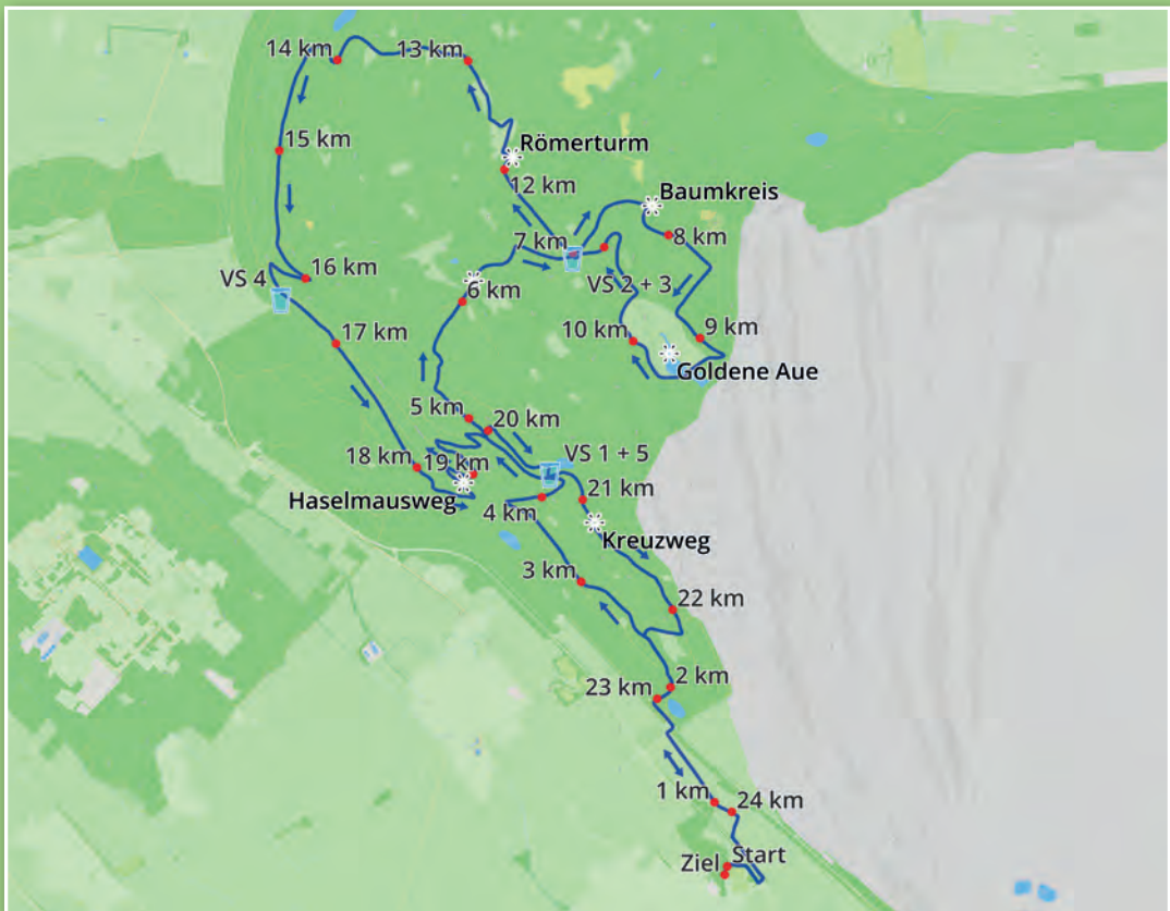
Strecke des Monte Sophia

Der Kreuzweg: Die Strecke führt entlang der schön angelegten Stationen des Kreuzwegs hinunter bis zum Parkplatz beim Niederzierer See.